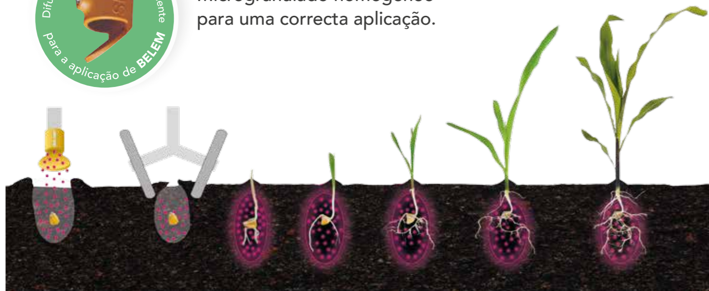
Protecção desde a sementeira

Microgranulado homogéneo para uma correcta aplicação.