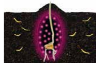
Após a sementeira

Forma uma barreira protectora contra as pragas, ao redor da semente.