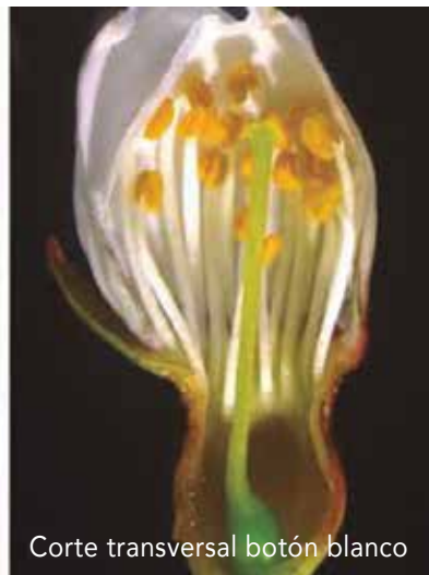
Corte transversal botón blanco