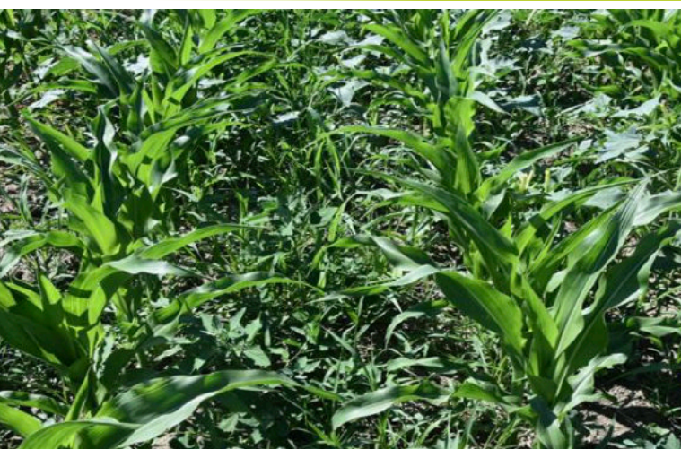
Netratat la 14 ZDA