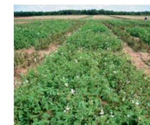
Nando 0,4 l/ha