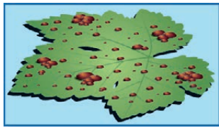
Cuivre classique (Bouillie Bordelaise)

Une fabrication brevetée : le sulfate de cuivre tribasique est associé à des mouillants et agents de dispersion de haute qualité.