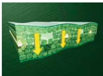
przemieszczanie w roślinie i odporność na zmywanie przez deszcz