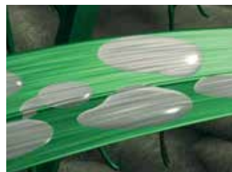
bardzo dobre pokrycie liści