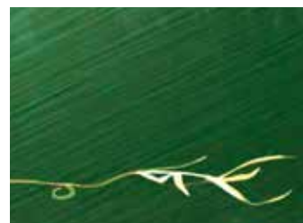
długotrwałe działanie na chwasty