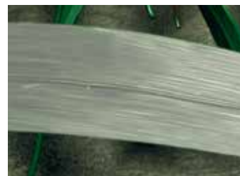
równomierne pokrycie liści