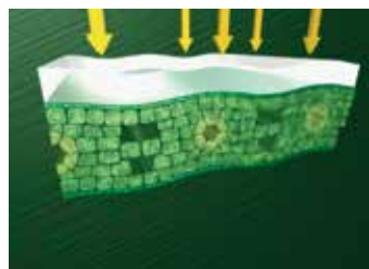
szybkie wchłanianie dzięki substancjom wspomagającym