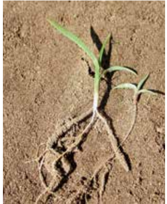
Hühner- (links) und Fingerhirse (rechts)