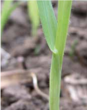
Halm und Blattränder behaart