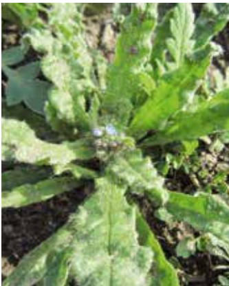
Rosettenstadium mit erster Blüte