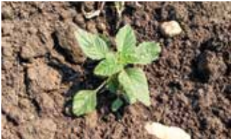
2. Laubblattstadium (oben); 4. Laubblattstadium (unten)