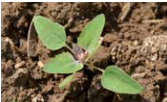
Keimblattpflanze (oben); Vierblattstadium (unten)