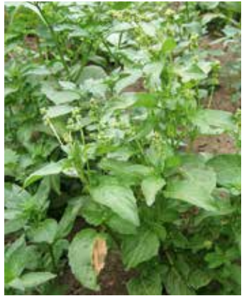
Pflanzen mit Fruchtständen