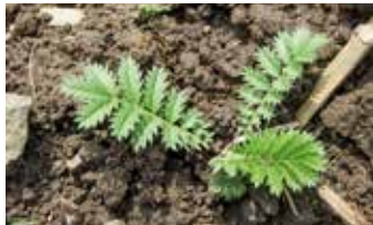
Aus Wurzelorganen austreibende Pflanzen