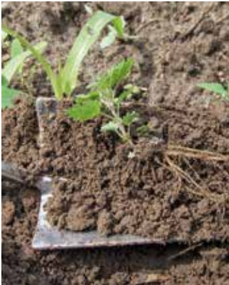
Austrieb aus der Wurzel