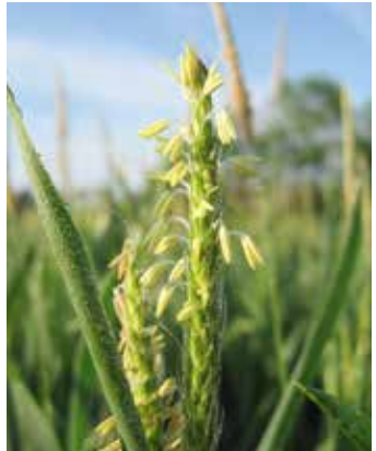
Ähre in der Blüte