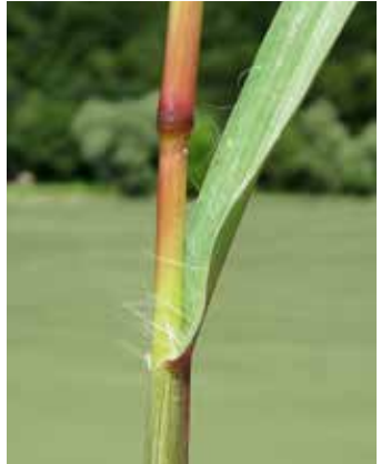
Behaarung am unteren Teil der Blattspreite