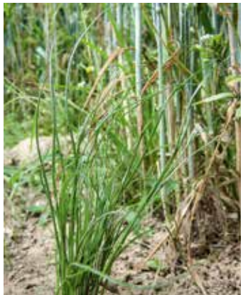
Runder, glatter Stängel