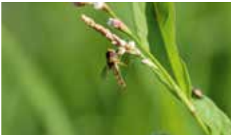
Tute mit Borstenhaaren (oben); Blüte (unten)