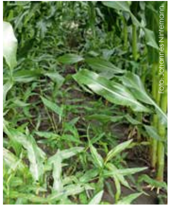
Massenhaftes Auftreten im Bestand