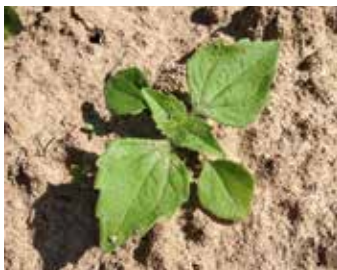
Vierblattstadium Behaartes Franzosenkraut