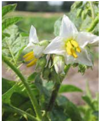
Blühende Pflanze, Stängel mit Stacheln besetzt