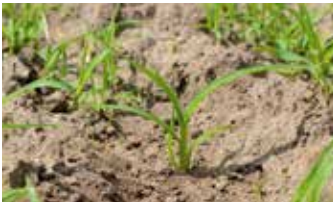
Keimblattstadium (oben); Vierblattstadium (unten)