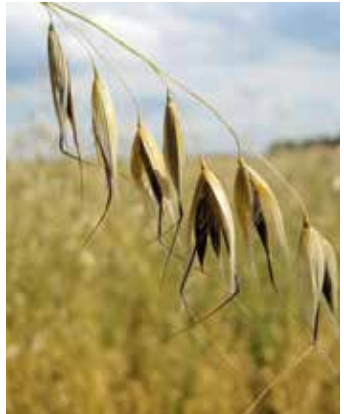
Abreifende Rispe mit Hüllspelze