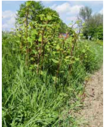
Etablierung an der Böschung