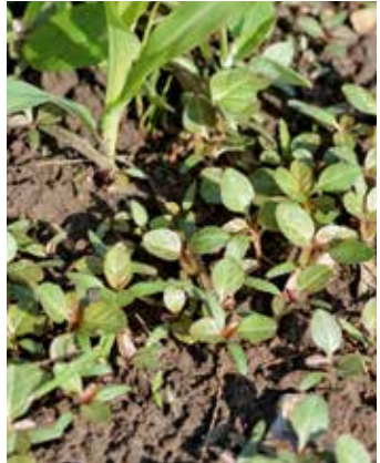
Pflanzen im Bestand