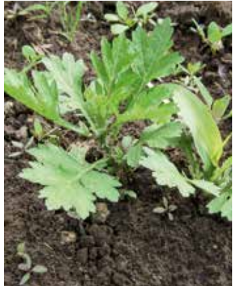
Austrieb aus Wurzelstock