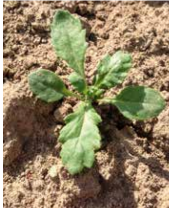
Drei- bis Vierblattstadium