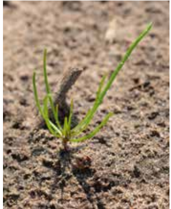
Vier- bis Sechsstadium