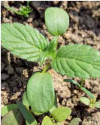
Zwei- bis Vierblattstadium