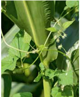
Pflanze mit Fruchtständen