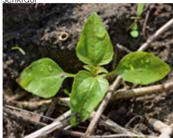
Vierblattstadium Kleinblütiges Franzosenkraut