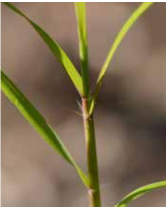
Stängel: Behaarung an den Blattansätzen