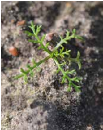
Vier- bis Sechsstadium