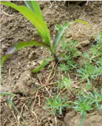
Junge Pflanze im Bestand