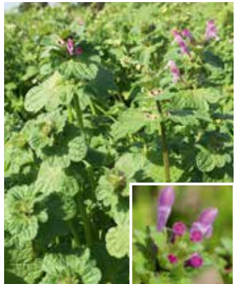
Blühende Pflanze und Blüte