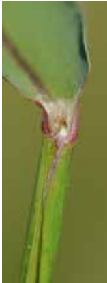
Blattscheide und Haarkranz