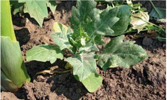
Pflanze im Rosettenstadium