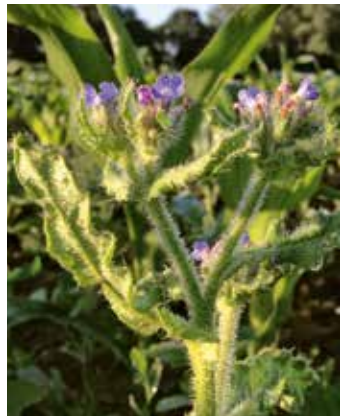
Blühende Pflanze im Bestand