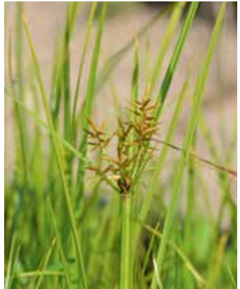
Pflanze mit Fruchtstand