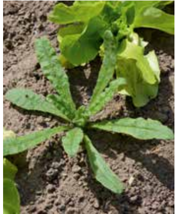
Gewellte und behaarte Blätter