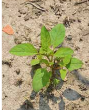
Pflanze mit rötlich angelaufenem Stängel