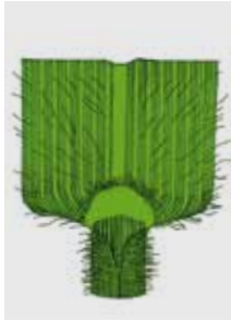
Zeichnungen: Arne Klingenhagen