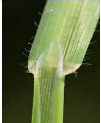
Blattscheide mit Blatthütchen