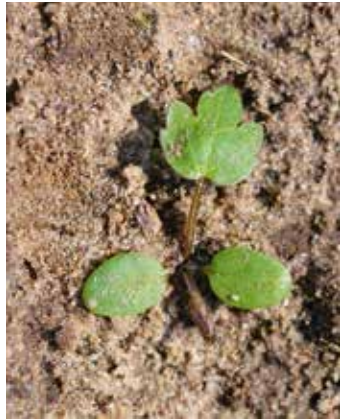
Erstes Laubblatt mit typischen Einkerbungen