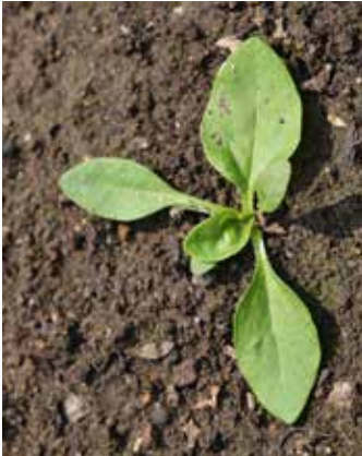
Zwei- bis Dreiblattstadium