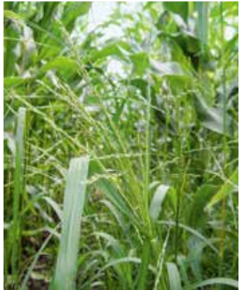
Pflanzen im Bestand