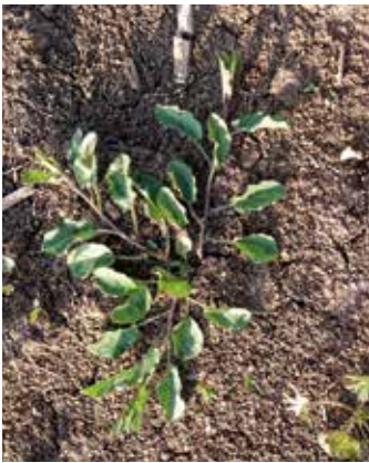
Zunächst kriechendes Wachstum