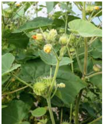
Pflanze mit Blüten und Fruchtkapseln