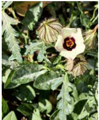
Blüte und Fruchtkapsel