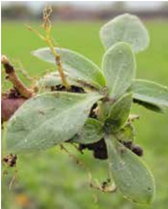
Neuaustrieb aus Wurzelrhizom