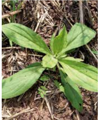
Vier- bis Sechsstadium