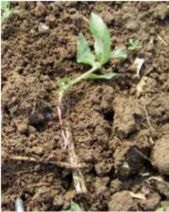
Rhizom und Neuaustrieb