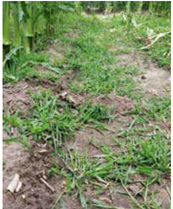
Pflanzen im Bestand