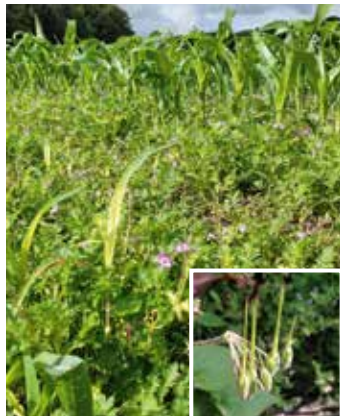
Blühende Pflanzen im Bestand und Fruchtstand (schnabelartig)