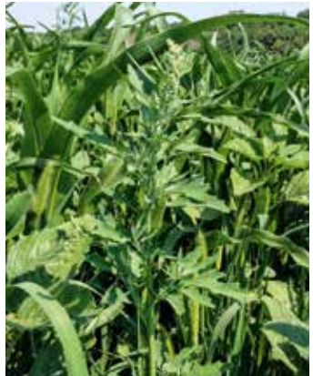
Pflanze im Bestand