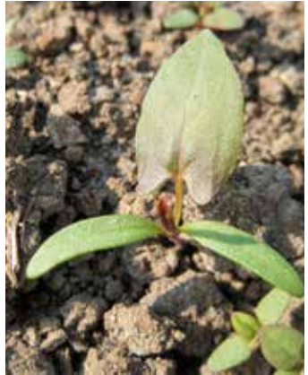
Spießförmiges 1. Laubblatt