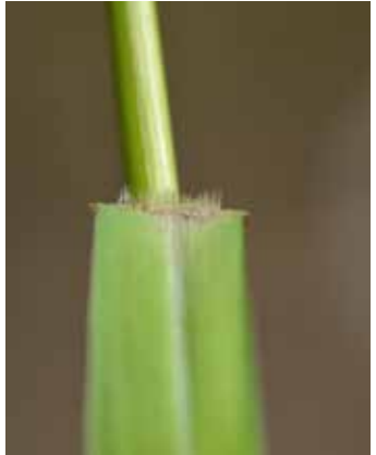
Haarkranz anstelle Blatthäutchen