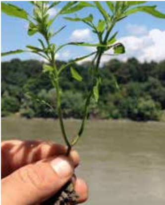
Herbstkeimer, klein, aber mit Fruchtstand