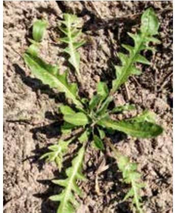
... oder auch stark gezähnt ausfallen