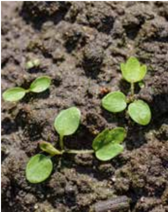
Keim- und Einblattstadium