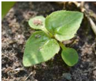
Zweiblattstadium Behaartes Franzosenkraut