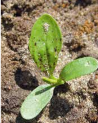
1. Laubblatt mit Flecken