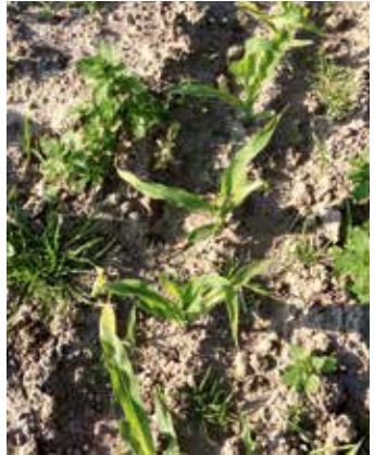
Pflanzen im Bestand