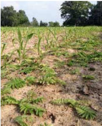
Pflanzen im Bestand