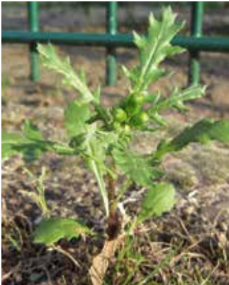
Kurz vor der Blüte