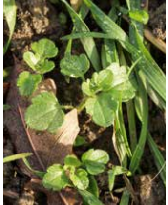
Zwei- und Vierblattstadium