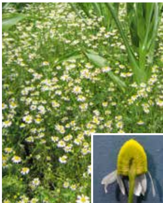
Pflanzen im Bestand; Echte Kamille mit hohem Blütenboden (Kleines Bild)