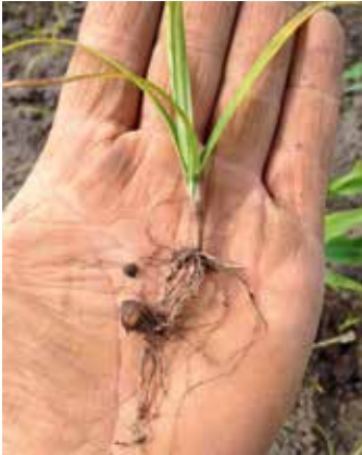
Wurzel mit Knöllchen