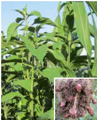
Pflanze und Knollen