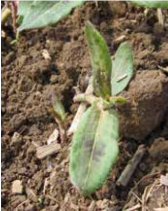
Junger, neuer Trieb