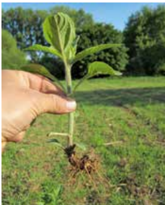
Aus Knolle ausgetriebene Pflanze