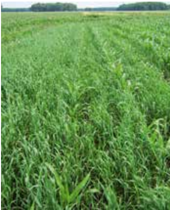
Pflanzen im Bestand