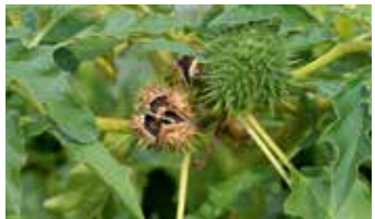
Pflanze mit stacheliger Frucht und den enthaltenen Samen