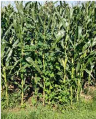
Pflanze im Bestand