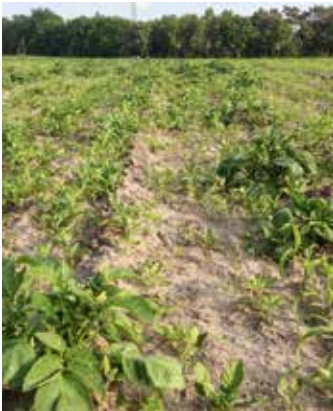
Mais nach Vorfrucht Kartoffeln