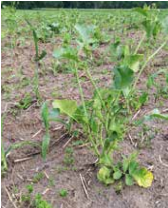
Nicht abgefrorene Pflanzen im Bestand