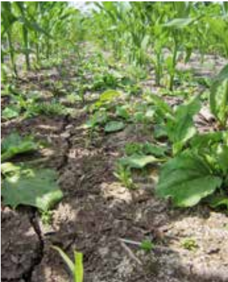
Pflanzen im Mais