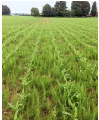
Pflanzen im Bestand