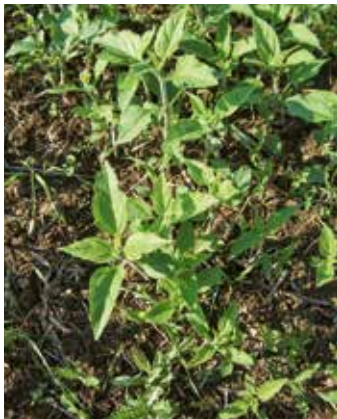
Vier- bis Sechsstadium