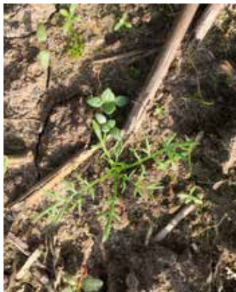
Fünf- bis Sechststadium