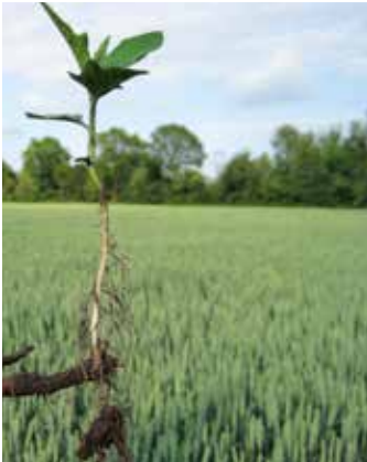
Neue Pflanze aus Wurzelrhizom