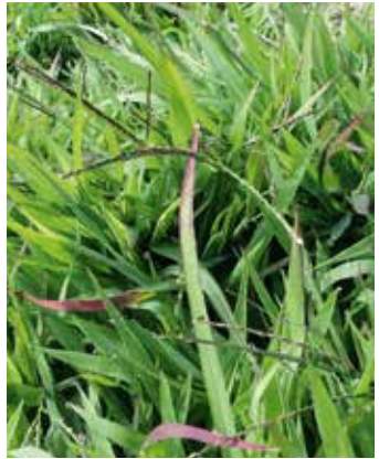
Pflanze mit Fingerähren im Bestand