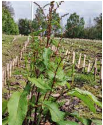
Pflanze mit Samenbildung