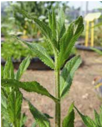
Blätter sind kreuz gegenständig angeordnet