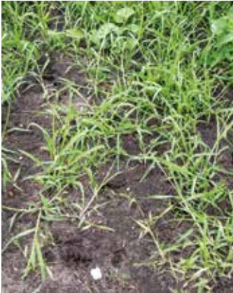
Pflanzen im Bestand