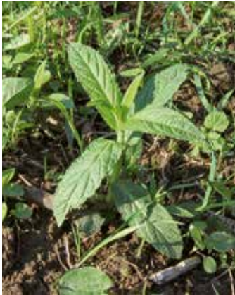
Neu ausgetriebene Pflanze