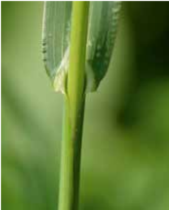
Ohne Blatthäutchen und Blattöhrchen