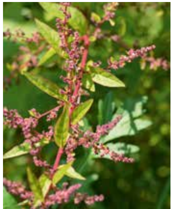
Rot leuchtender Fruchtstand