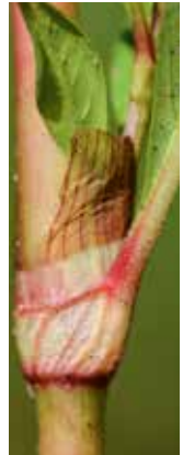
Tute nicht behaart