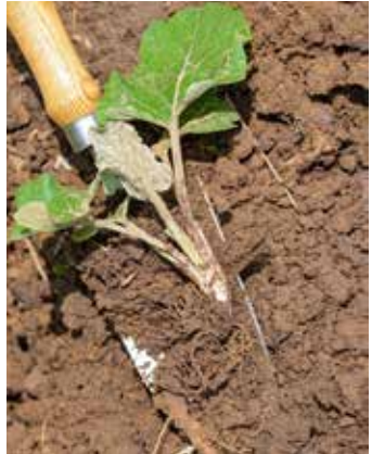
Frühjahrsaustrieb aus Speicherorgan (Wurzel)