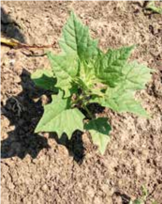
Übergang zum Längenwachstum