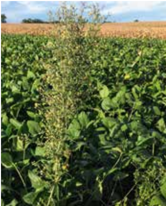
Pflanze mit Glyphosat-Resistenz