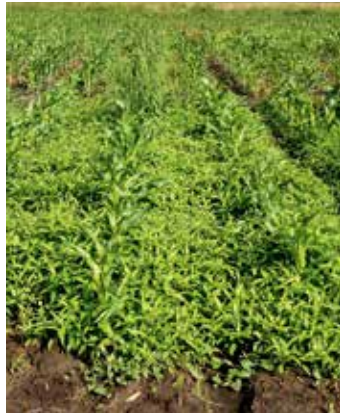
Starker Besatz an vernässter Stelle