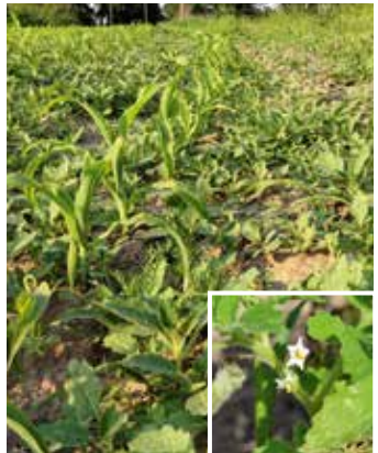
Pflanzen im Bestand und Blüte