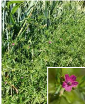
Blühende Pflanzen im Bestand und Blüte