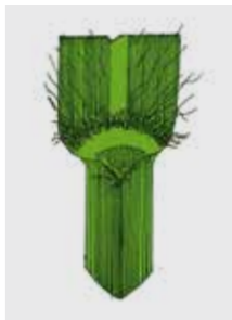
BLUTROTE FINGERHIRSE Digitaria sanguinalis