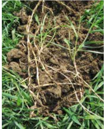
Ober- und unterirdisches Wachstum