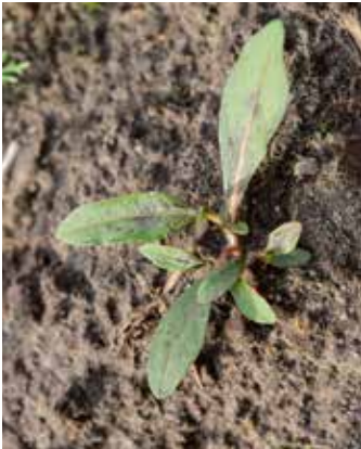
Beginn der Verzweigung