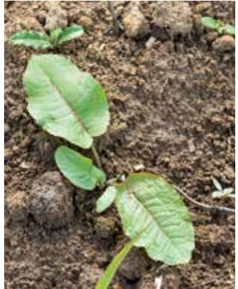
Austrieb aus Wurzelstock