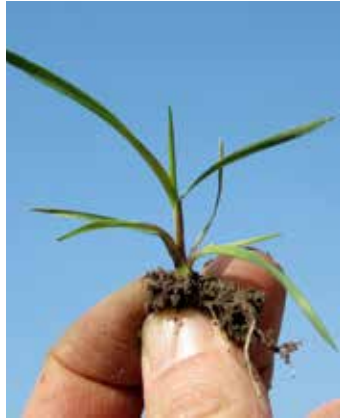
Kurz vor der Bestockung