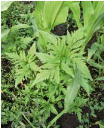
Pflanzen im Maisbestand