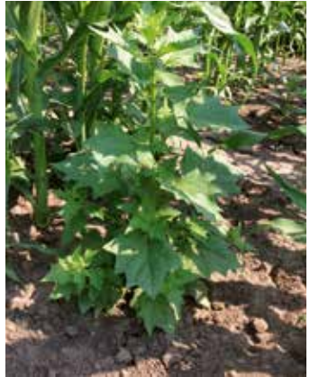
Pflanze im Bestand