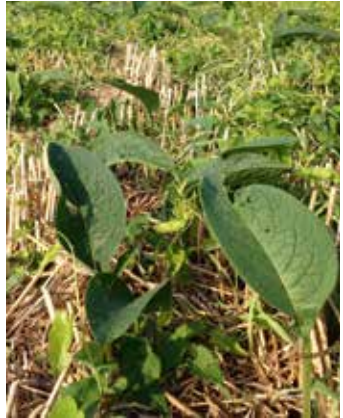
Neuaustrieb nach der Getreideernte