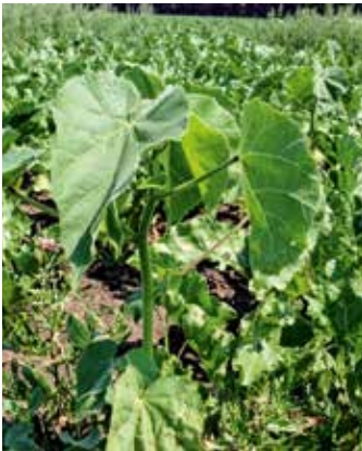
Junge Pflanze im Bestand