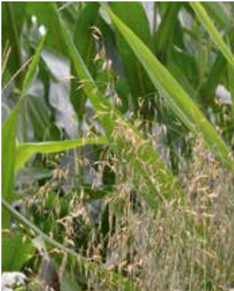
Pflanzen im Bestand