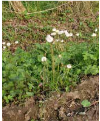
Pflanze mit reifen Samen, die an einem Schirmchen hängen