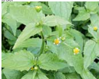
Blühendes Kleinblütiges Franzosenkraut