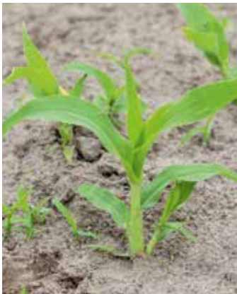
Vier bis Sechsstadium