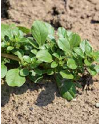
Sehr flache Blätter