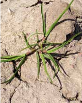
Zunächst flaches Wachstum