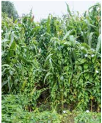
Winden können Mais zu Boden ziehen