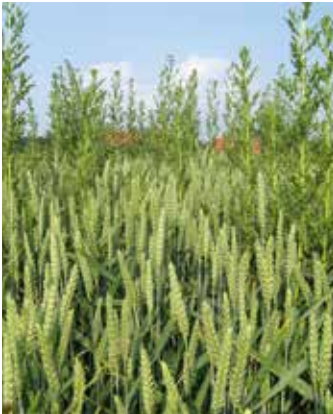
Pflanze im Bestand