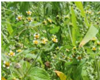
Blühendes Behaartes Franzosenkraut