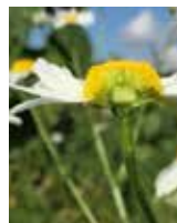
Blüte (oben), Querschnitt (unten links) und Samen (unten rechts)