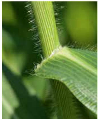
Stängel und Blattränder sind stark behaart