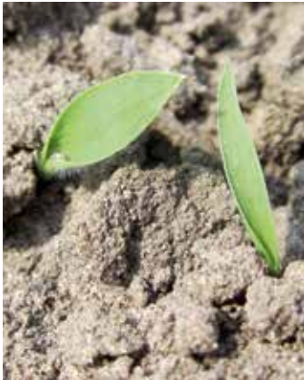
Keimblattstadium; Rispengrass- (links) und Hühnerhirse (rechts)