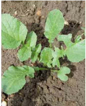
Vier- bis Sechsstadium