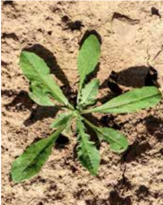
Kann eher glattrandig ...