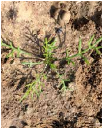
Blattstielansätze rötlich angelaufen