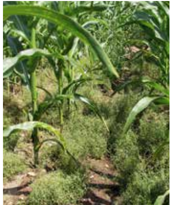
Blühende und fruchtende Pflanzen im Bestand