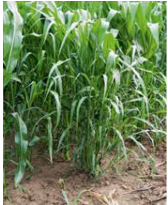
Pflanze im Bestand