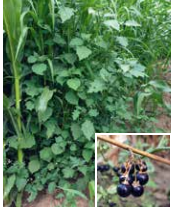
Pflanzen im Bestand und reife Frucht