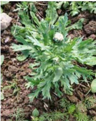
Kurz vor der Blüte