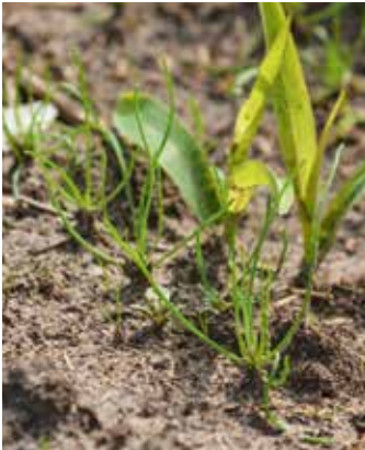
Junge Pflanze im Bestand