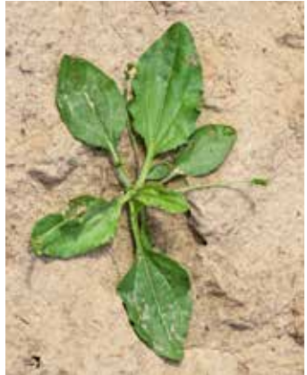
Rosette mit Samenanlagen