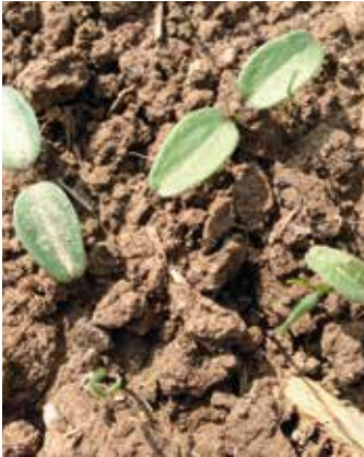
Keimblattstadium mit leichter Einkerbung an den Blattenden