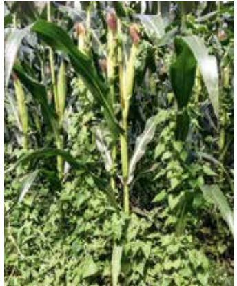
Am Mais emporwindende Pflanzen