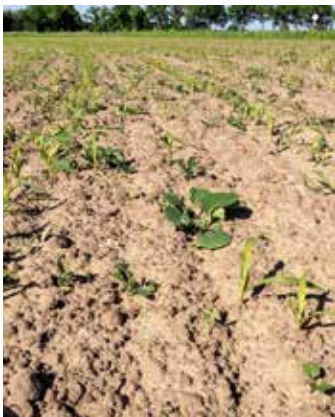
Raps in Maisbestand