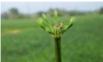
Sumpf- (oben) und Ackerschachtelhalm (unten) – „Acker außen lang“