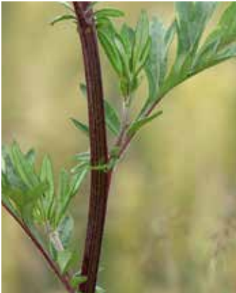
Rotbraun gefärbter Stängel