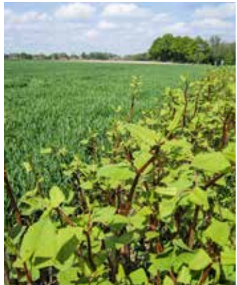
Einwanderung in den angrenzenden Schlag