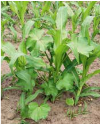
Junge Pflanze im Bestand