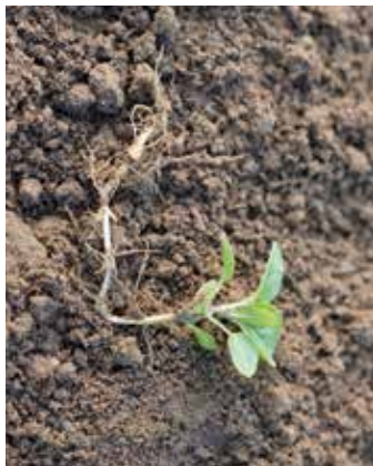
... und das dazugehörige Wurzelrhizom