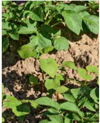
Pflanzen im Bestand