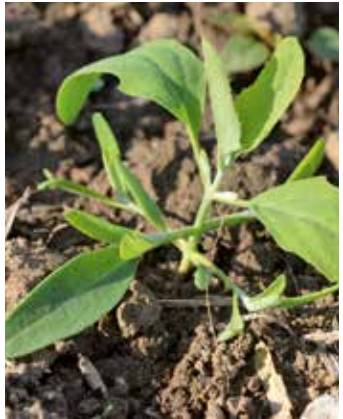
Junge Pflanze mit kreuz-gegenständiger Blattstellung