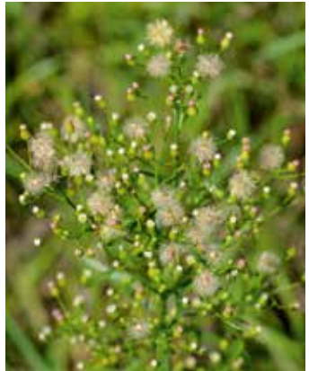
Samen werden über Wind verbreitet