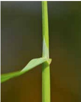
Sehr langes Blatthütchen