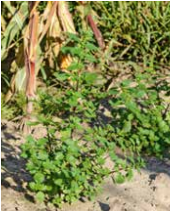
Pflanze mit Fruchtständen