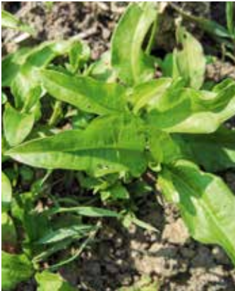
Typisch ist die hellgrüne Farbe