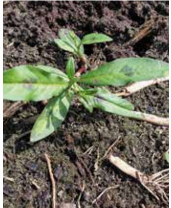
Beginn der Verzweigung