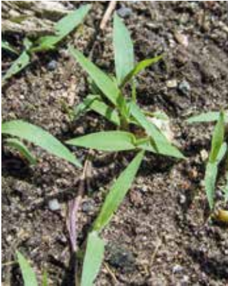
Ein- bis Zweiblattstadium