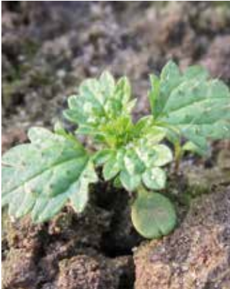
Keimblätter mit Einkerbung