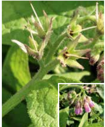
Blüte und Samenanlage