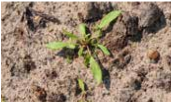
Keimblattstadium (oben); Vierblattstadium (unten)