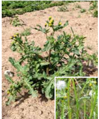
Pflanze mit Samen