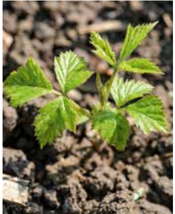
Neuaustrieb aus Wurzeln