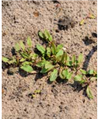
Auswuchs aus Rhizom A