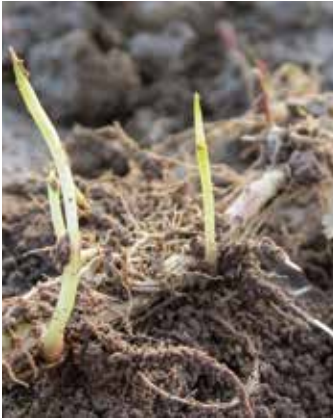
Austrieb aus Rhizom