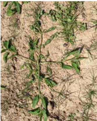
Typisch ist der zunächst kriechende Wuchs