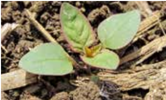
Keimblattstadium (oben); Zweiblattstadium (unten)