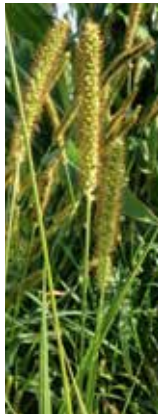
Fruchtstände gelb bis fuchsrot