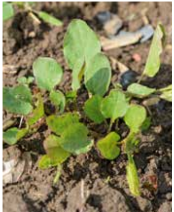
Neuaustrieb an unterschiedlichen Stellen