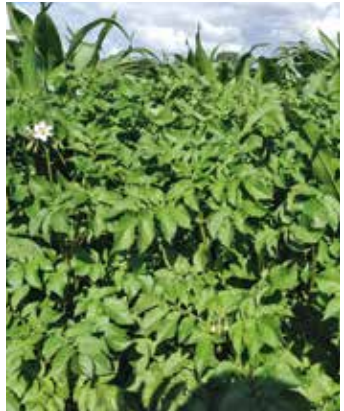
Blühende Pflanze im Bestand