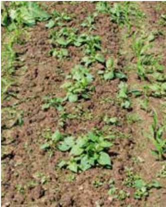
Junge Pflanzen im Bestand