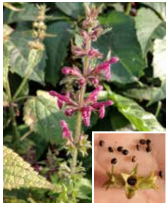
Blüte und Samen