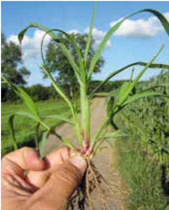
Platter unterer Stängelteil