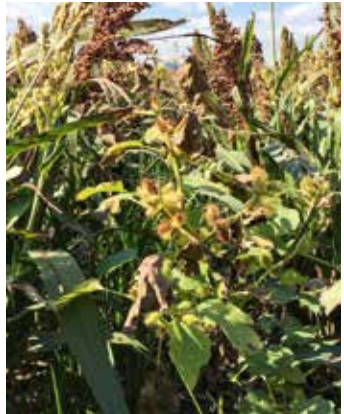
Pflanze mit Kletten