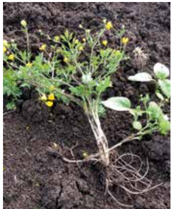
Blühende Pflanze mit Wurzel