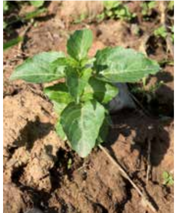
Vier- bis Sechsstadium