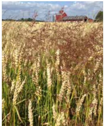
Pflanzen im Bestand