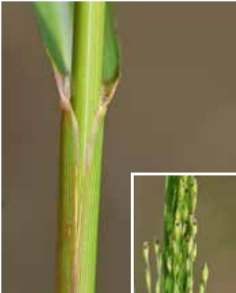
Blattscheide und Blüte