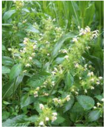
Blühende Pflanzen im Bestand