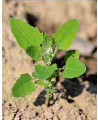
Sechs- bis Achtblattstadium