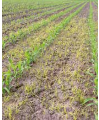
Junge Pflanzen im Bestand