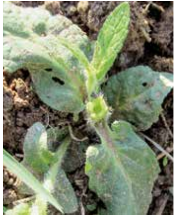
Stängel, vierkantig und hohl