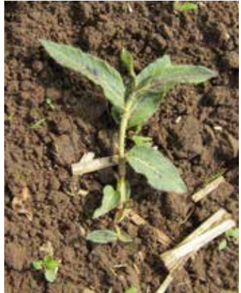
Zunächst niederliegender Wuchs