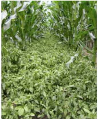
Pflanzen im Bestand