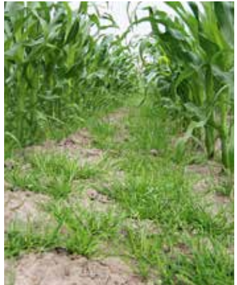
Pflanzen im Bestand