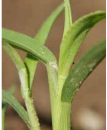
Haarkranz anstelle eines Blatthäutchens