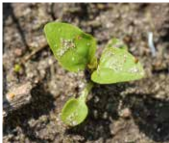
Zweiblattstadium Kleinblütiges Franzosenkraut