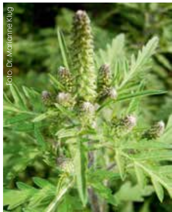
Pflanzen mit Fruchtstand