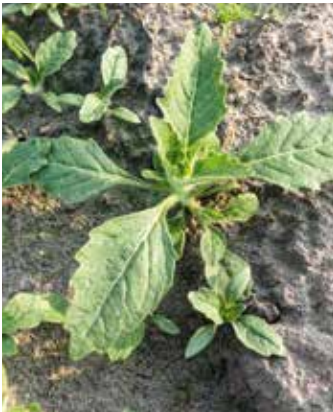
Pflanzen in verschiedenen Stadien