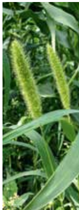
Fruchtstände mit grünen Grannen