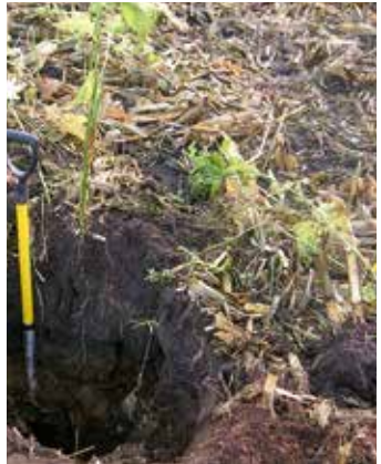
Horizontale und vertikale Rhizom- ausbreitung