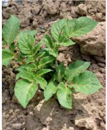
Austrieb aus der Knolle