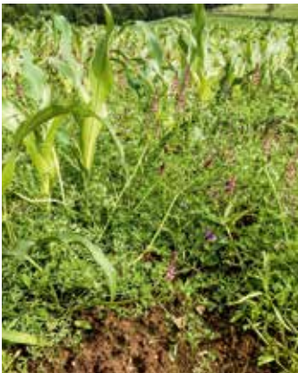
Blühende Pflanze im Bestand