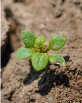
Aus Samen aufgelaufene Pflanze