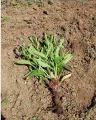
Pflanze mit Wurzelstock