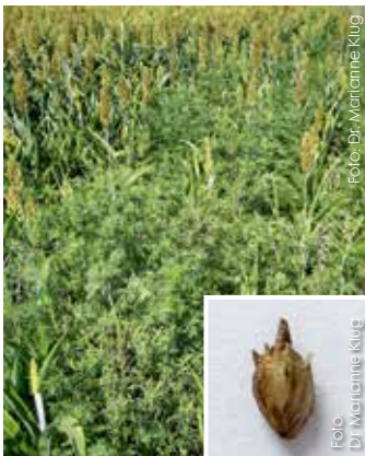
Pflanzen im Bestand und Samen