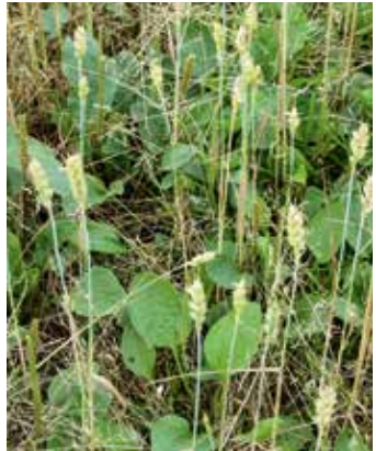
Pflanzen im Getreide