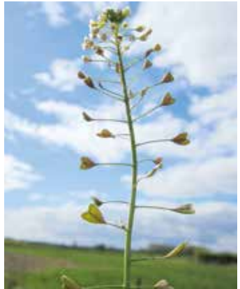
Blüte und Fruchtkörper in Form einer Hirtentasche