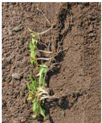
Auswuchs aus Rhizom B