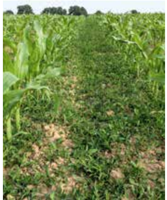
Pflanzen, die die Herbizidbehandlung überstanden haben