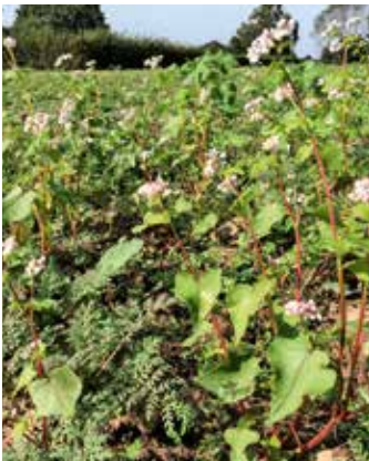
Blühende Pflanzen als Zwischenfrucht