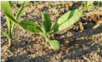
Keimblattstadium (oben); Zweiblattstadium (unten)