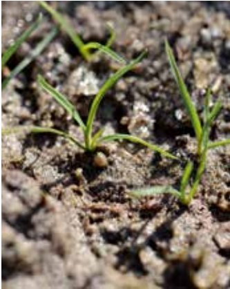
Zwei- bis Dreiblattstadium