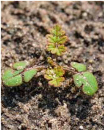
Typische, unverwechselbare Keimblätter