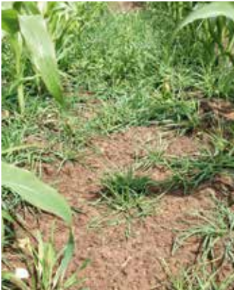
Pflanzen im Bestand