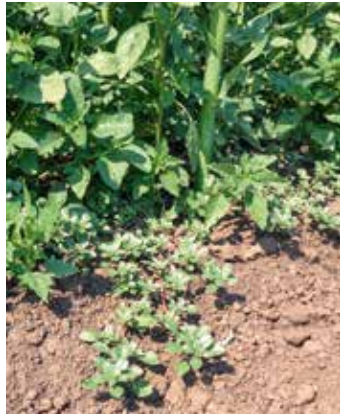
Pflanze im Bestand