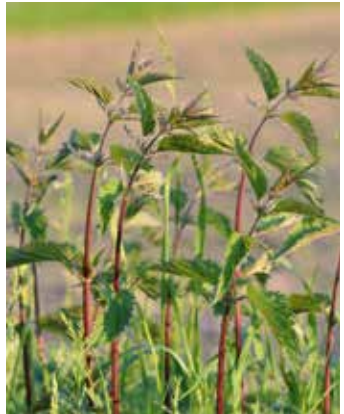
Pflanzen mit Fruchtständen