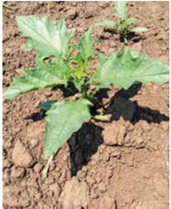
Vier- bis Sechsstadium