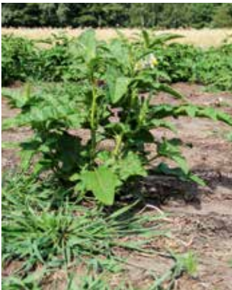
Frisch aus Rhizom entwickelte Pflanze