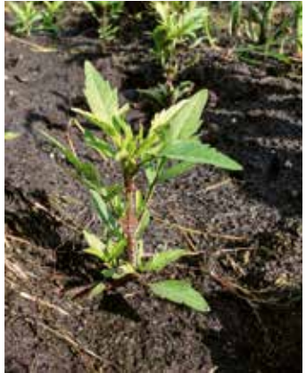
Bei Nässe fühlt sich Zweizahn wohl