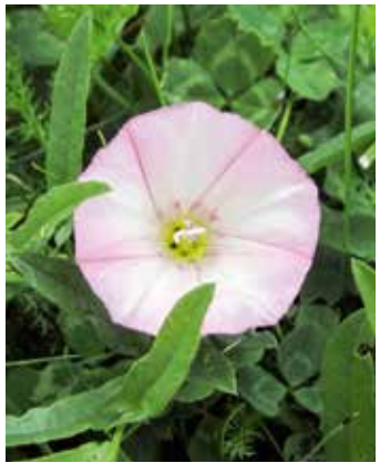
Blüte, rosa gestreift