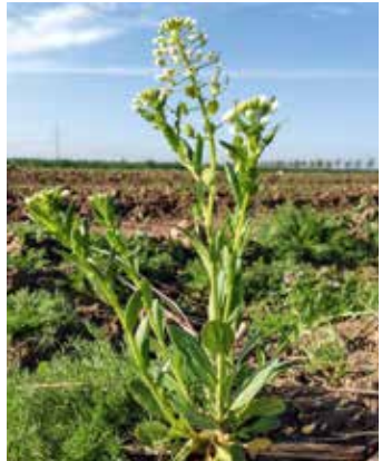
Blühende Pflanze mit ersten „Tellerkapseln“