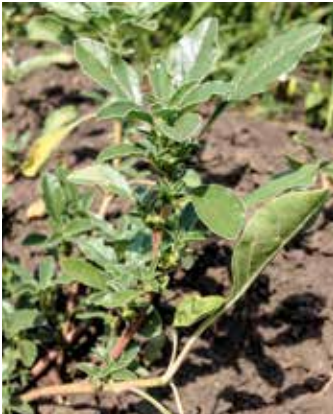
Stark glänzende Blätter