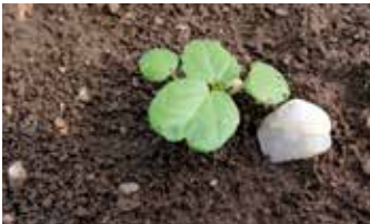
Keimblattstadium (oben) Zweiblattstadium (unten)