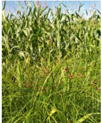
Pflanzen im Bestand