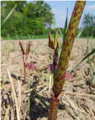
Neuaustrieb im April