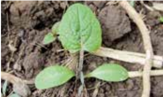
Keimling aus Samen (oben), Austrieb aus Wurzel (unten)