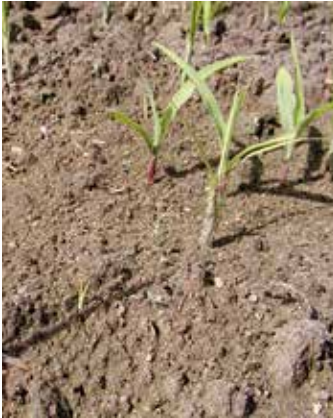
Austrieb aus Speicherorgan