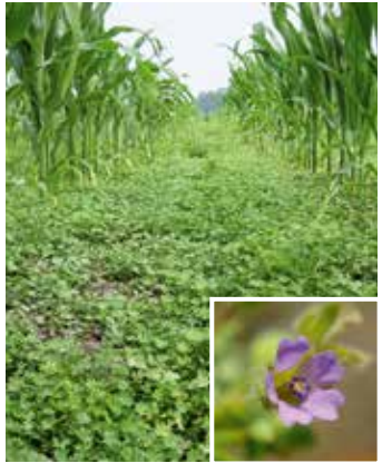
Pflanzen im Bestand und Blüte