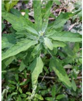
Blätter sternförmig angeordnet