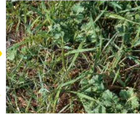
Quecke in Raps