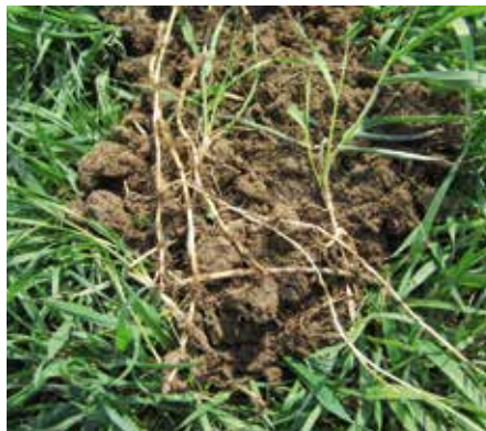
Gemeine Quecke ( Elymus repens )

Schnellere und erhöhte Wirkstoffaufnahme dank ISOLink- Technologie