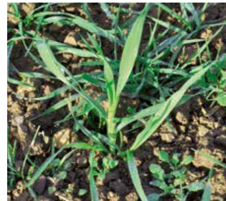
Flughaffer ( Avena fatua )