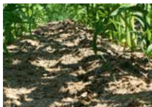
Mit NAGANO® Smart COMBO