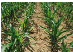
Mit ZEAGRAN® Clean COMBO