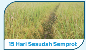
15 Hari Sesudah Semprot

KUPROXAT dapat diaplikasikan untuk mencegah dan menyembuhkan serangan Kresek ( Xanthomonas campestris )