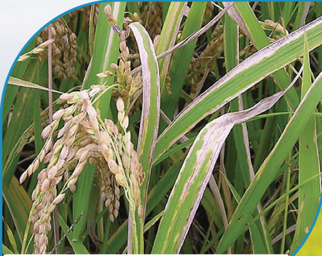
Kresek Pada Padi